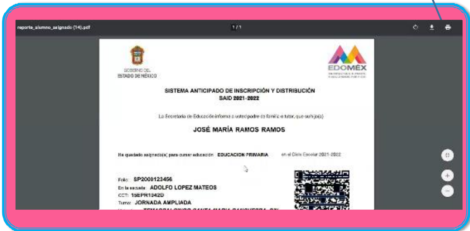
Imagen 4 Detalle Comprobante de Asignación.