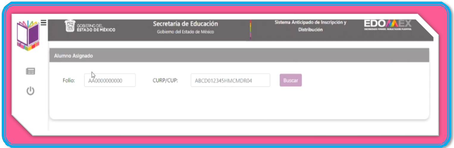
Imagen 1 Pantalla de Ingreso a la consulta de resultados.

Es necesario que antes de consultar el lugar donde fue asignado el menor para cursar el nivel educativo, el padre de familia tenga a la mano el FOLIO de registro de preinscripción o la Clave Única del Registro de Población (CURP), o con la Clave Única de Preinscripción (CUP). Para ingresar a la página del SAID, deberá ingresar el FOLIO que se generó cuando se registró el alumno(a) en el sistema de preinscripciones o con la CURP del Alumno, o con la Clave Única de Preinscripción (CUP), tal y como se muestra en la Imagen 1.