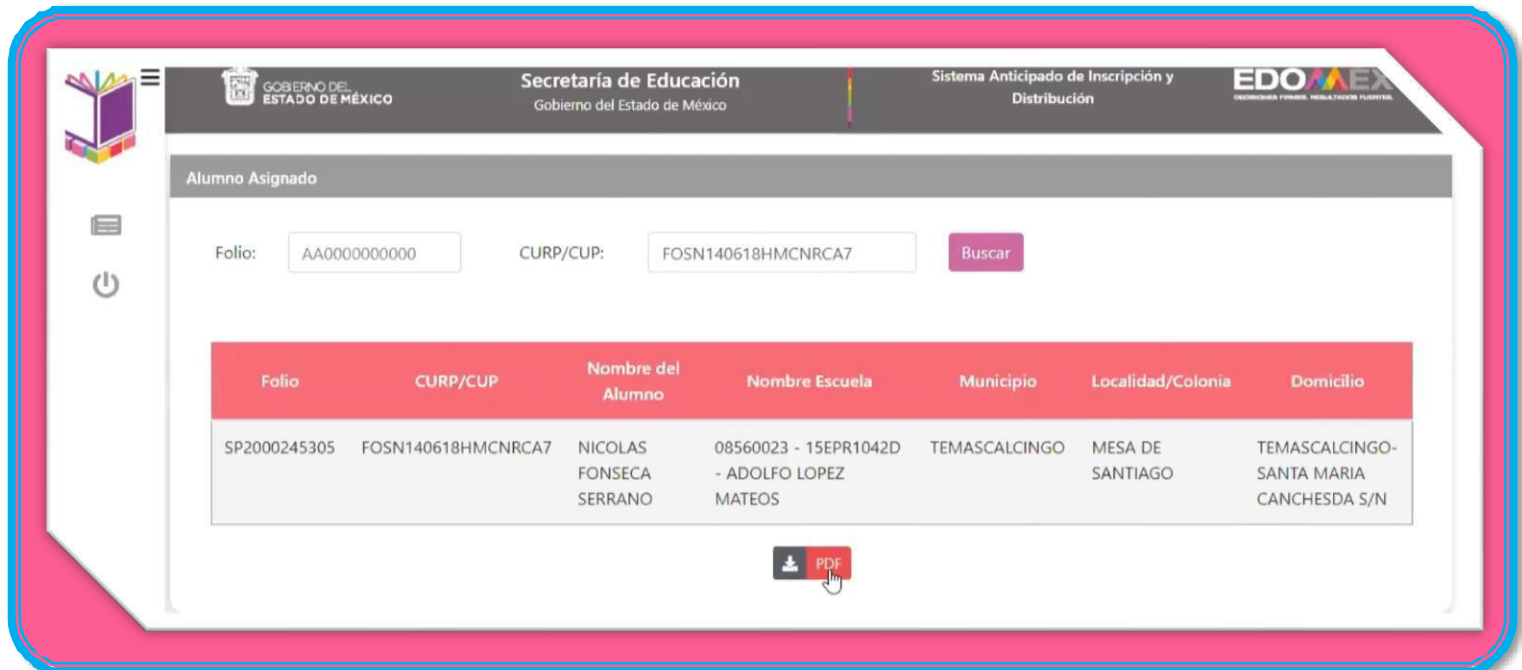
Imagen 2 Pantalla de despliegue de resultado de la asignación.

Al pulsar el botón "PDF" se descargará el comprobante de asignación, como se muestra en la Imagen 3.